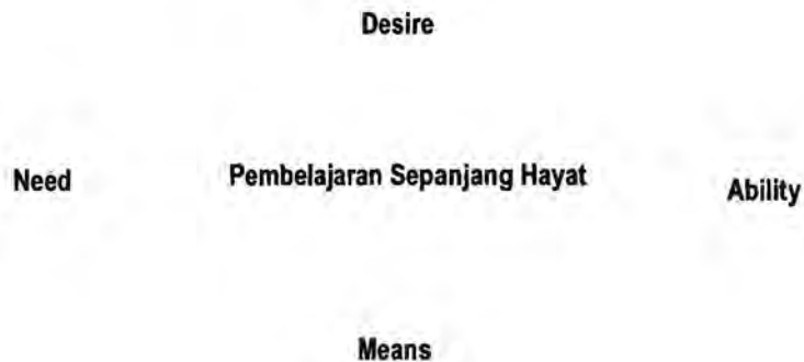
Rajah 3: Reka bentuk sokongan (Scaffold) terhadap proses pembelajaran sepanjang hayat yang efektif

Pembelajaran sepanjang hayat yang efektif memerlukan input ekstrinsik dan intrinsik. Sesungguhnya, ia melibatkan keseluruhan (DAMN) Cycle: Desire (Keinginan) dan Ability (Kemampuan) untuk belajar daripada pihak pelajar, Means (Makna) bagi menyokong pembelajaran dan pengertian terhadap Need (Keperluan) bagi merangsang kesemua aspek ini.